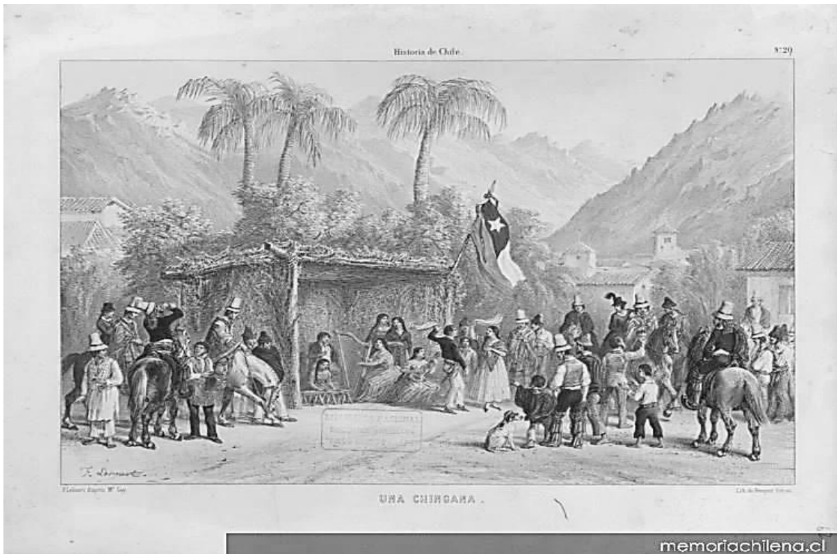
Gay, C. (1854). Una chingana, 1854 [Grabado]. Memoria Chilena. http://www.memoriachilena.gob.cl/602/w3-article-98716.html

¿Qué fenómeno histórico se infiere a partir de la imagen anterior?