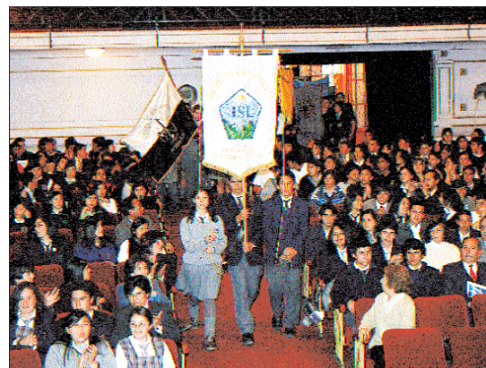
Escolares participan cada año en las Olimpiadas del Conocimiento.

• Las Olimpiadas del Conocimiento, hace competir año a año a los mejores alumnos de terceros y cuartos medios en materias como: Biología, Castellano, Física, Historia, Matemática y Química en pruebas que se cumplen en distintos niveles hasta llegar a disputar los primeros lugares. Los ganadores de cada una de estas pruebas y categorías reciben becas de arancel o becas completas por los tres primeros años de la carrera, cumpliendo con el propósito de estrechar vínculos entre los colegios de enseñanza media y la